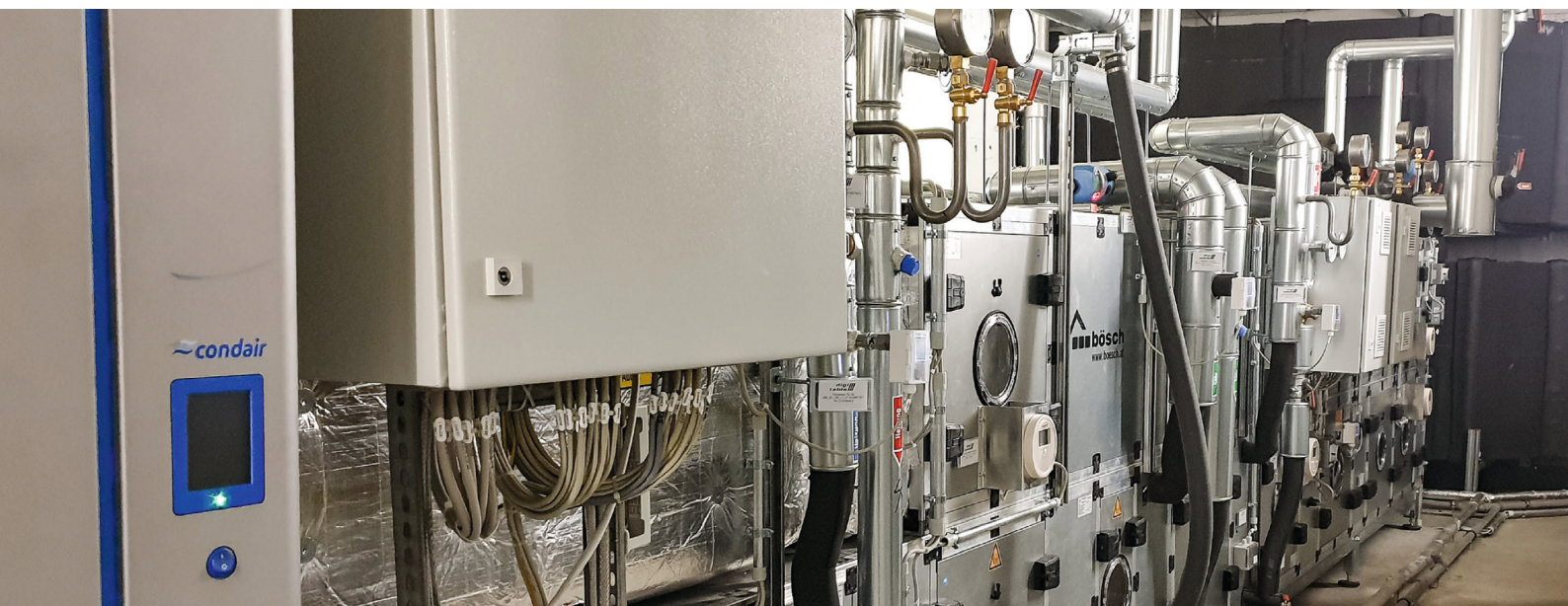
MDR-Landesfunkhaus Sachsen-Anhalt, Magdeburg - Erneuerung Lüftungsgeräte und Umbau Wärmerückgewinnung