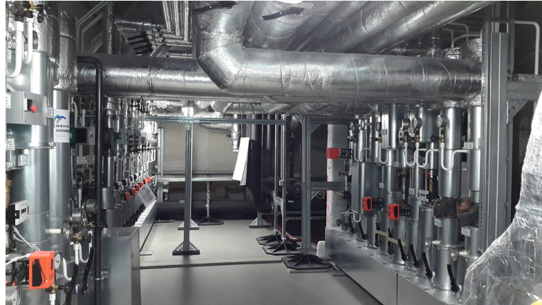
Neues Rathaus Dresden - Dachzentrale

In Planung ist, das System zukünftig ab der ersten Kostenschätzung einzusetzen sowie die BIM-Funktionalitäten zu nutzen, da die TGA-Spezialisten ihre Projekte bis auf wenige Ausnahmen in 3D planen. Mit dem Erweiterungsmodul BIM2AVA 4.0 zum Raum- und Gebäudebuch von California.pro können die Ingenieure 3D-Modelldaten des CAD-Systems visualisieren und analysieren sowie diese zur automatisierten Mengenermittlung und Kostenplanung in BIM-Prozessen verknüpfen. Die Bauteile werden für die automatisierte Mengenermittlung aufbereitet und für schnelle Kostenplanungen gruppiert.