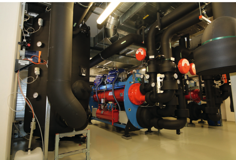
Deutsche Gesetzliche Unfallversicherung - Kälte und Wärmeversorgung

Dazu bedient er sich verschiedener Methoden. Zum einen pflegt der TGA-Ingenieur die Preissteigerungen, die er von den Händlern erhält, ein. Zum anderen filtert er bei den Bieterpreisen die Ausreißer heraus, bildet von den restlichen den Mittelwert und schreibt diesen ins Stamm-LV zurück. Darüber hinaus überprüft er einmal jährlich alle Preise und aktualisiert sie, wenn notwendig. Vorteilhaft empfindet Schreier, dass er sich in California.pro die entsprechenden Positionen herausfiltern kann und den prozentualen Aufschlag nur einmal eingeben muss. Das spart enorm viel Zeit.