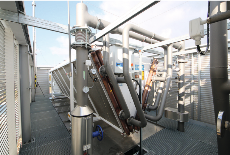
Deutsche Gesetzliche Unfallversicherung - Kälte und Wärmeversorgung