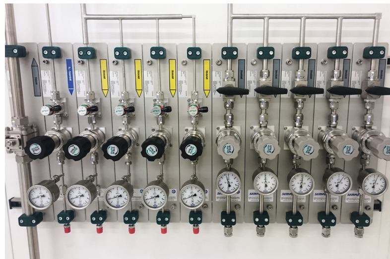
Fraunhofer-Institut für Photonische Mikrosysteme - Technische Gase